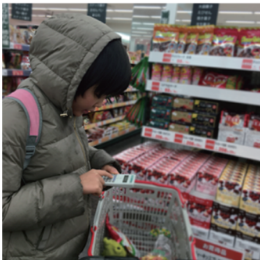
出来ないと決めつけない介助

体幹が無い人の体の介助は、介助者が指先に神経を集中し、その集中した神経を利用者につける事