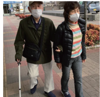
物の位置が寸分変わらない介助