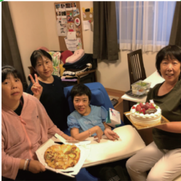
愛おしさに包まれた介助

障がい者(利用者)は、中々現状を健常者から理解されない為に、障がい者(利用者)を愛おしさの温もりで包み込む事